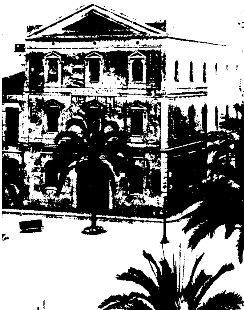
Antic edifici de l'Escola Industrial