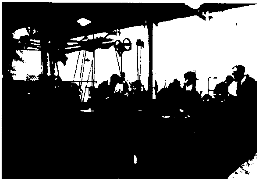
Escola Universitària Politècnica de Vilanova i la Geltrú. 1.- Tallers de fusteria (anys 50). 2.- Tallers de torns (anys 60).